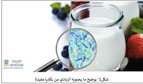
شكل1: يوضح ما يحتويه الزبادي من بكتريا مفيدة

وكانت دراسات سابقة قد أكدت أن تناول كميات كبيرة من اللبن الرائب يقلل من الإصابة بسرطان الأمعاء، بسبب تأثيره الإيجابي على البكتريا الموجودة طبيعياً في الأمعاء والتي تسمى "ميكروبيوم".